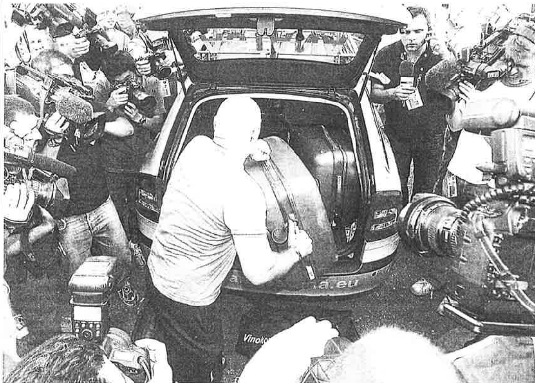
Astana taldeko langile bat, iazko uztailaren 24an, Aleksandr Vinokurovek positibo eman ostean Kazakhstango taldeak Tourra utzi zuen egunean.