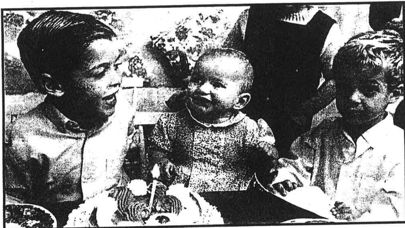
Bereizketa krisi garala da eta seme-alabek oso momentu txarrak pasatzen dituzte. Hurrek, sarri, gurasoak berriro elkartuko direlako fantasía izaten dute.

Bikote batek bereiztea erabakitzen duenean bi bide ditu seme-alaben zaintza finkatzeko: alde batetik, elkarrekin akordio bat egin eta epaitegian beharrezko arauzko indarra ematea; bestetik, hasiera-hasteratik epaitegira jozteko epaileak erabaki dezan. Akordioarena ez da erraza, banaketa krisi garaia izaten baita, eta orduan adostasuna lortzeko zailagoa baitirudi. Epaitegietan, berriz, alde bakoitza ahalik eta eteknik handiena ateratzen saiatzen da.