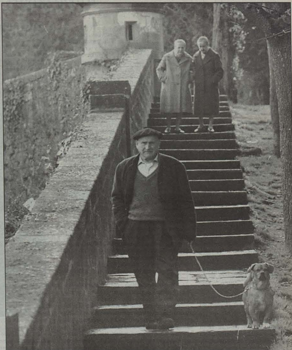
Hainbat iruindar Harresietako Barbazana pasealekuan.

■ Descalzos kaleko 72. zenbakian, Erraldoien Aretoan, Iruñeko Udalak antolatu Iruñeko Hirigune Historikoko Harresientzako Ideien Lehiaketako lan sarituak daude asteleheneetik ikusgai, hilaren 24ra arte. Datorren astelehenean, proiektuen egileek emanen dute euren proposamenen berri leku berean, arratsaldeko zazpi eta erdietan, eta hilaren 24an mahai-ingurua egingen dute. Iruindarrek, beraz, izanen dute etorkizuneko harresiak nolakoak izanen diren ezagutzeko aukera. Iruñeko Alde Zaharrean gertatzen diren gauza gehienek bezala, iritzi kontrajarriak piztuko dituzte, ziurrenik, arkitektoek plazaratutako ideia ezberdinek. Eta mota guztietakoak badira. ■