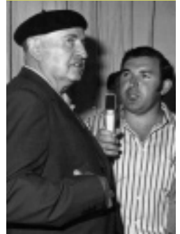
Izarraitz pilotalekuaren berrinaugurazioa, Atano III. arekin.